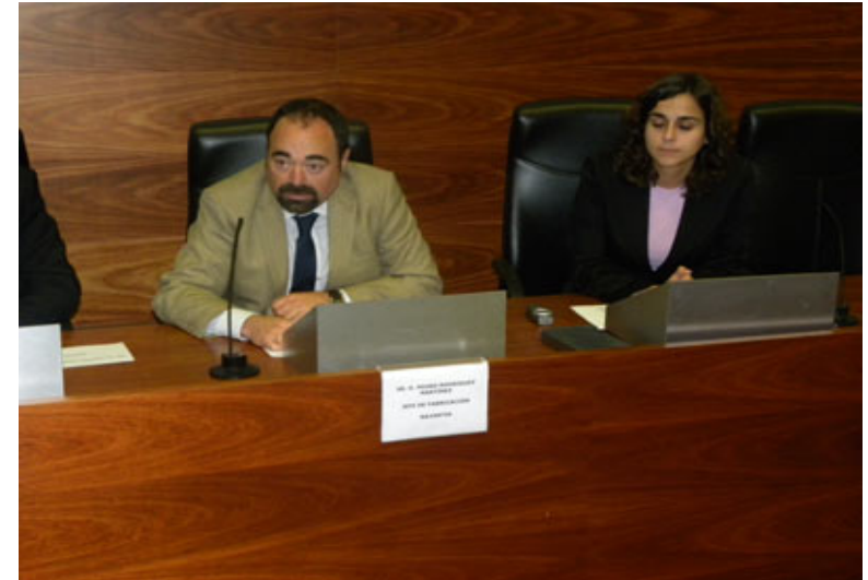
Presentación de la ponencia de Navantia.