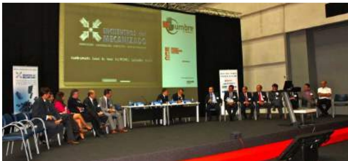
Vista de todos los socios de honor asistentes al Encuentro